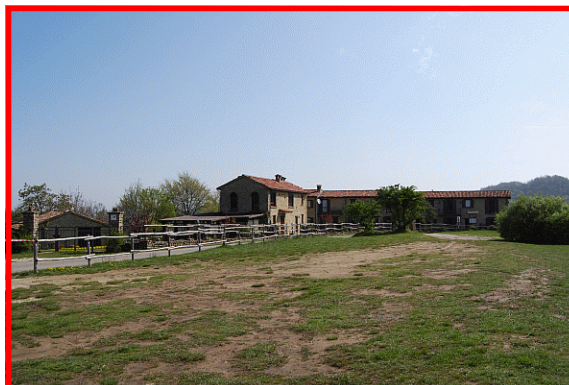
Cà del Monte

Il Servizio Parchi individua i sentieri più significativi degli 8 settori al fine di promuovere forme di turismo a basso impatto ambientale e una migliore conoscenza del nostro territorio.