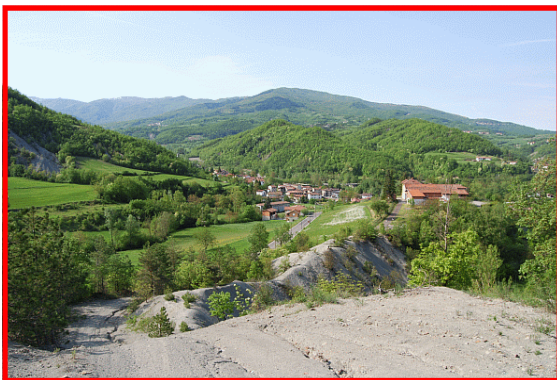
Discesa verso Fabbrica Curone

Stazione Ferroviaria di Tortona Autolinee ARFEA (tel. 0131 445433 - E-mail: arfea@interbusiness.it) Linea Alessandria—Tortona—Caldiola