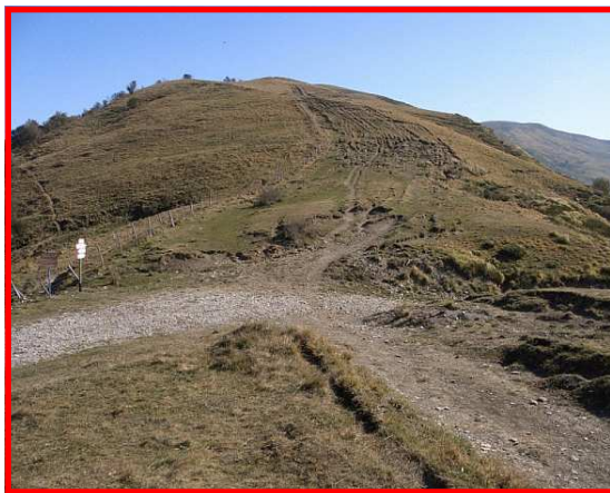
Il valico di Bocca di Crenna 1553 m

Il Servizio Parchi individua i sentieri più significativi degli 8 settori al fine di promuovere forme di turismo a basso impatto ambientale e una migliore conoscenza del nostro territorio.