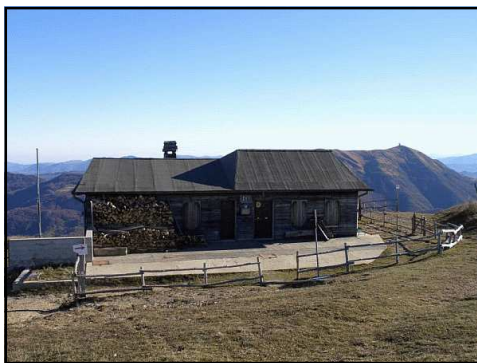
Il Rifugio del Monte Chiappo 1700 m