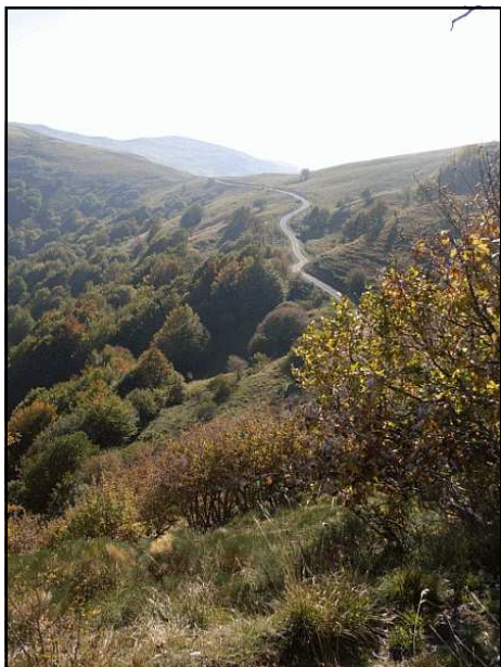
Veduta verso il valico di Bocca di Crenna

Segnaletica: segnavia CAI 108 Difficoltà: E (Escursionistico) Lunghezza: 6,49 km Tempo di percorrenza: 2 ore 45 m