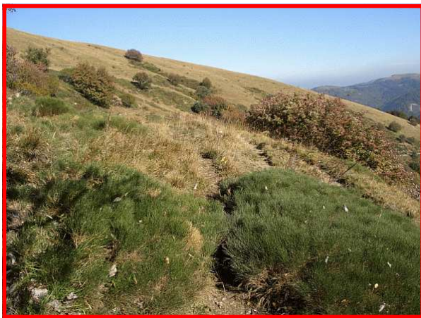
Le pendici del Monte Ebro

Autolinee ARFEA (tel. 0131 445433 - E-mail: arfea@interbusiness.it)