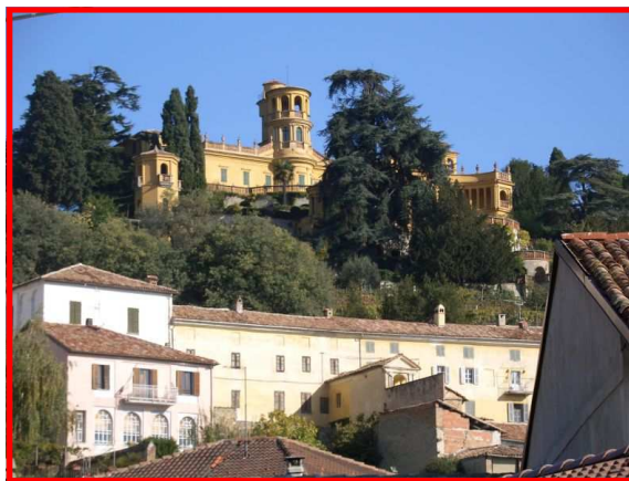
Il Castello di Villadeati

Il Servizio Parchi individua i sentieri più significativi degli 8 settori al fine di promuovere forme di turismo a basso impatto ambientale e una migliore conoscenza del nostro territorio.