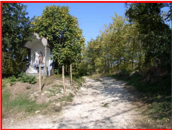
La strada verso Murisengo

Estratto dalla CTR 1:50.000 in formato vettoriale Regione Piemonte - Settore Cartografico Autorizzazione N. 7/2007 del 9/5/2007 (Riproduzione vietata)