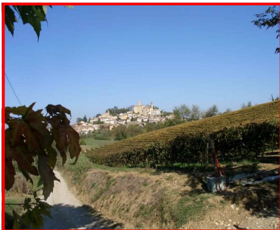
Arrivo a Murisengo

Autostrade A26 Voltri-Sempione Uscita Casale sud SS 457 in direzione Torino fino al bivio per Murisengo Parcheggio nella piazza antistante il municipio