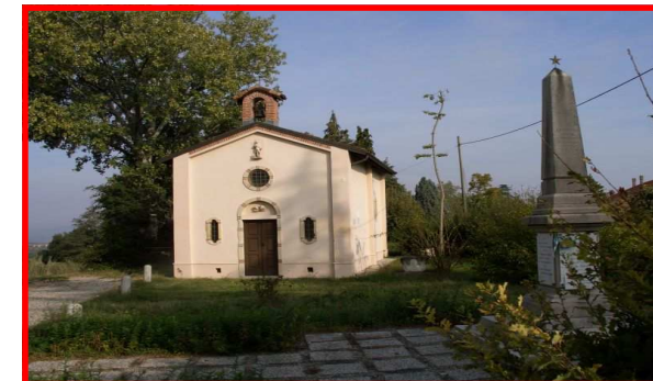
La chiesetta di S.Rocco