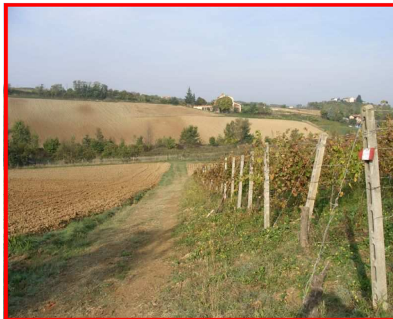
Tra campi e vigneti

Il Servizio Parchi individua i sentieri più significativi degli 8 settori al fine di promuovere forme di turismo a basso impatto ambientale e una migliore conoscenza del nostro territorio.