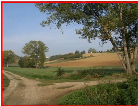
Il percorso nei pressi della cascina Borghina

Autostrade A21 Alessandria ovest Ex SS 31 in direzione Alessandria, SP 50 in direzione Vignale e SP 67 in direzione Conzano Parcheggio nella piazza antistante la Farmacia