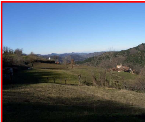
Veduta delle colline