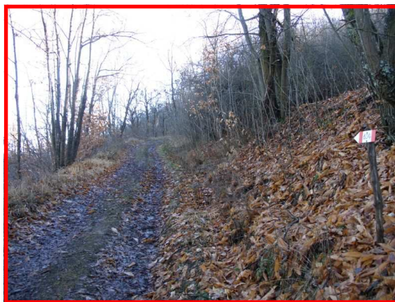
Il sentiero tra i castagni

Il Servizio Parchi individua i sentieri più significativi degli 8 settori al fine di promuovere forme di turismo a basso impatto ambientale e una migliore conoscenza del nostro territorio.