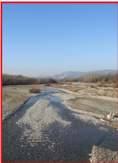
Il torrente Borbera

Stazione Ferroviaria di Arquata Scriveria Autolinee ARFEA (tel. 0131 445433 - E-mail: arfea@interbusiness.it)