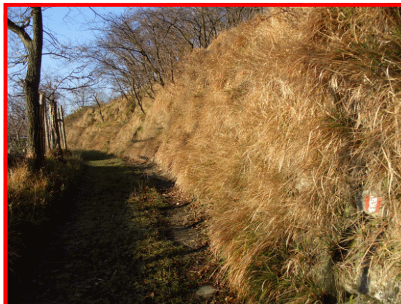
Verso il paese di Sezzella

Il Servizio Parchi individua i sentieri più significativi degli 8 settori al fine di promuovere forme di turismo a basso impatto ambientale e una migliore conoscenza del nostro territorio.