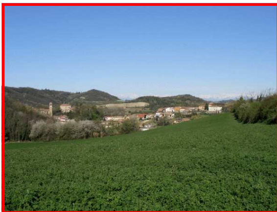
Veduta di Ottiglio

Autostrada A21 Alessandria Ovest Ex SS 31 in direzione Alessandria, SP 50 in direzione Vignale e SP 48 per Olivola ed infine SP 42 per Ottiglio