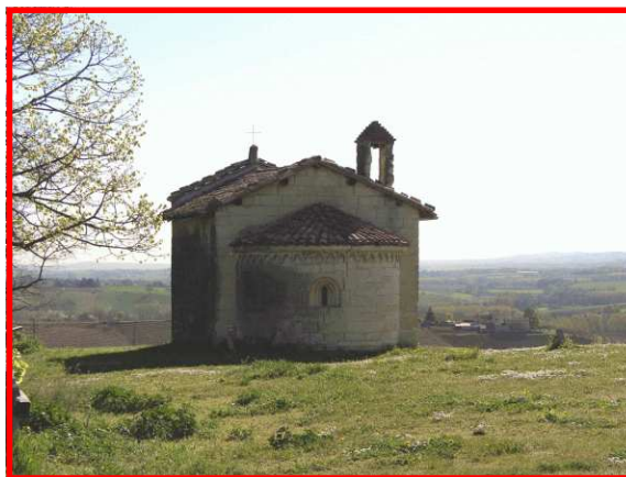
La chiesetta di San Michele

Il Servizio Parchi individua i sentieri più significativi degli 8 settori al fine di promuovere forme di turismo a basso impatto ambientale e una migliore conoscenza del nostro territorio.