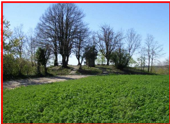
L'altura degli 8 tigli

Estratto dalla CTR 1:50.000 in formato vettoriale Regione Piemonte - Settore Cartografico Autorizzazione N. 7/2007 del 9/5/2007 (riproduzione vietata)