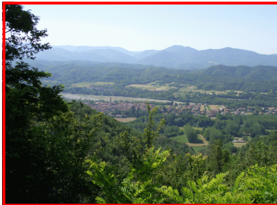
Panorama dal Santuario

Il Servizio Parchi individua i sentieri più significativi degli 8 settori al fine di promuovere forme di turismo a basso impatto ambientale e una migliore conoscenza del nostro territorio.