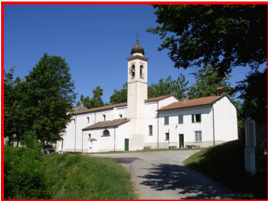
Il santuario della Madonna di Cà del Bello

Stazione ferroviaria di Arquata Scrivia Autolinee Arfea Tel. 0131—445433 E-mail: arfea@interbusiness.it