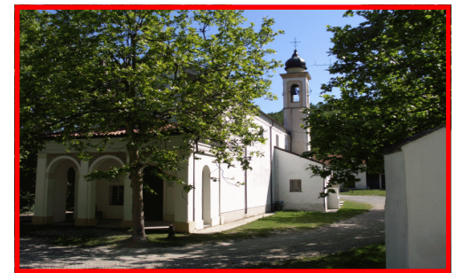
Veduta del Santuario