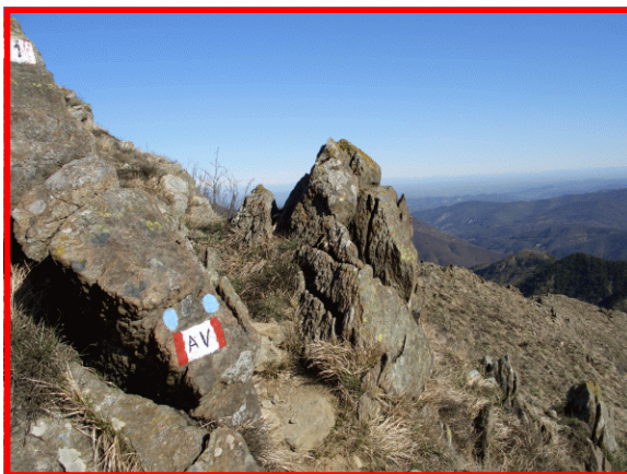
Passaggio tra le rocce

Seguire direzione Gavi Voltaggio e seguire la SP 160 fino a giungere al valico Passo del Bocchetta