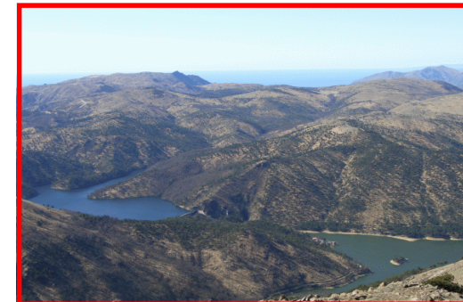
Veduta dei laghi del Gorzente e il Mar Ligure