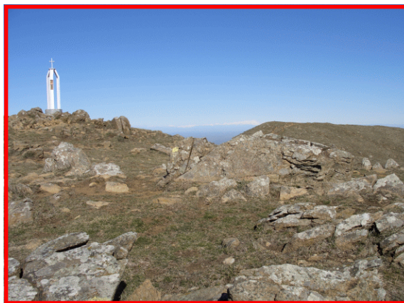
La vetta del Monte delle Figne (mt. 1172)

Il Servizio Parchi individua i sentieri più significativi degli 8 settori al fine di promuovere forme di turismo a basso impatto ambientale e una migliore conoscenza del nostro territorio.