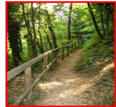
Discesa verso il torrente Borbera