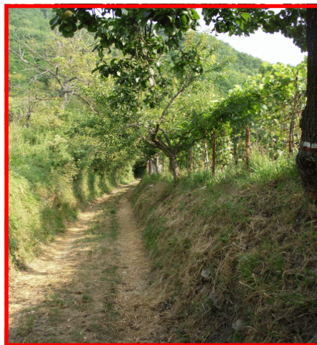
Il sentiero tra i vigneti

Il Servizio Parchi individua i sentieri più significativi degli 8 settori al fine di promuovere forme di turismo a basso impatto ambientale e una migliore conoscenza del nostro territorio.