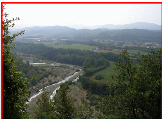
Scorcio panoramico sulla Val Borbera

Tel. 0131-445433 E-mail: arfea@interbusiness.it